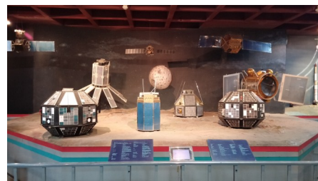
Индустриальный и технологический музей Вишвешварая