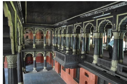
Дворец Типу Султана

Основные туристические достопримечательности в городе и рядом Бенгалуру представляют собой Бангалорский дворец, Центр наследия HAL и аэрокосмический музей, государственный музей, Видхана Саудха, Аттара Качери, Карнатака Читракала Парашатх, Аквариум, музыкальный фонтан, озеро Улсоор, парк Каббон, Международный Ашрам «искусство жизни» (21 км), озеро Хессарагатта (29 км), горы Нанди (60 км), водохранилище Канва (69 км) и горная станция Девараянадурга (70 км).