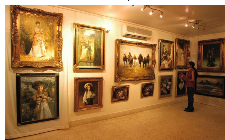
Художественная галерея Венкатаппа